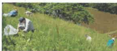
道路法面の傾斜地で除去作業