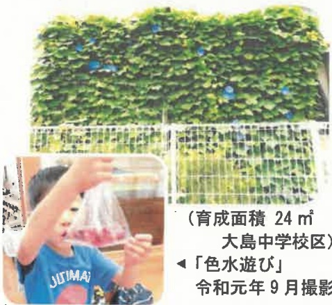
(育成面積 24㎡ 大島中学校区) ◀「色水遊び」 令和元年9月撮影