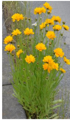
自生する オオキンケイギク

北米原産の「オオキンケイギク」が、ひたちなか市内でも自生し密生しているところが見受けられます。オオキンケイギクは、5〜7月にかけて、コスモスの花に似た鮮やかな黄色の花を咲かせます。生命力・繁殖力が強い多年生の草花です。一度定着すると、在来の植物を駆逐することが確認され、特定外来生物(植物)に指定されました。