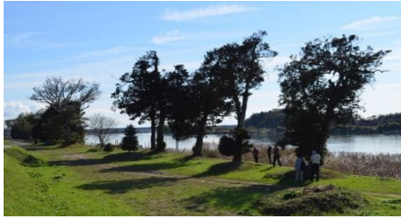
風そよぐ百色山緑地休養広場

百色山は三反田地区の那珂川岸にあり面積約1・2ha、長さ約800mの細長い平地です。約3分の1を緑地休養広場として市が管理し、続く樹林帯は国交省