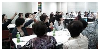
「は～い！ 私も わかります」

5月23日、市毛コミセンで様々な活動をしている、すみれ学級29名の参加のもと『私の食が地球・世界をつくる』講座を本会の会員が講師で