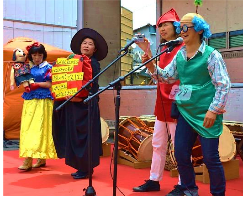
笑顔にあふれる環境劇

た、竹の間伐材を利用した万華鏡作り、竹ぼっくり、ぶんぶんゴマのほか、ペットボトルを利用した念力遊び等も用意し、子どもたちも大喜びでした。竹のキャンドル立てのプレゼントも喜んでいただきました。