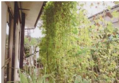
緑のカーテンで2、3℃涼しく

本会では、昨年度から地球温暖化対策や夏季の省エネ対策として「緑のカーテン」に取り組んでいます。