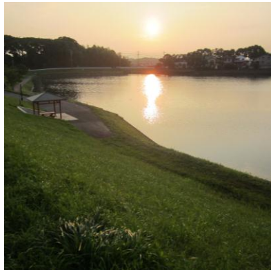
市民の憩いの場所・名平河公園

名平河(なへいどう)は、ひたちなか海浜鉄道湊線の那珂湊駅から道路をたどると北へ約1kmの位置にある遊水池です。北側から雨水や湧水が流入し、西側に設けられた水門から流出し、相金町などを經由し栄町水門で那珂川につながります。野鳥の飛来が多く風光明媚で、市民の憩いの場所となっています。 しかし、アオコが発生し悪臭が漂う事態が頻発しています。