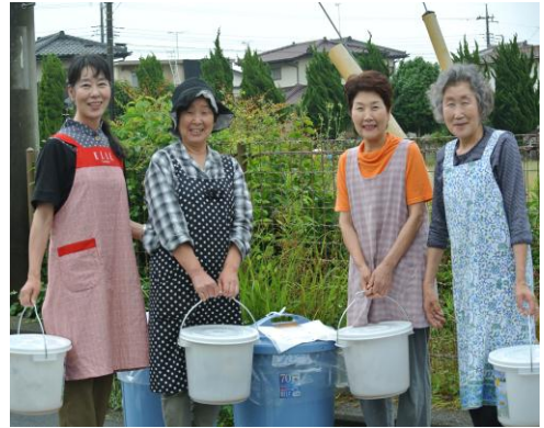
生ごみを大型バケツに移す協力者たち

100世帯参加の生ごみ堆肥化モデル実証試験が、6月から3か月の収集期間限定で始まりました。ご協力いただいたのは、柳が丘自治会と東根自治会の各50世帯の皆様です。今まで焼却ごみに出していた生ごみを分別して、専用バケツに入れて週2回集積場の大型バケツに移すというやり方で収集しています。集積場は資源回収ステーションとして柳が丘4か所、東中根5か所に大型バケツを置いてあります。皆様の分別は大変丁寧でご協力に感謝いたします。