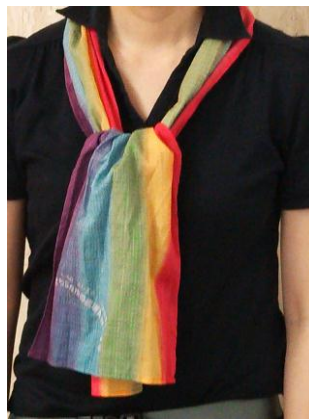
選ばれたスカーフ