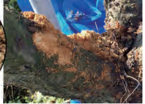
堆積したフラス 被害を受けた木の根元や幹の股などには、排出口から落ちたフラスが大量に堆積します。樹液が混ざるとペースト状になります。