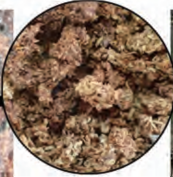
フラスのクローズアップ 比較的固いものから簡単に崩れるものまで様々です。若い幼虫のものは細く、成長すると太くなります。