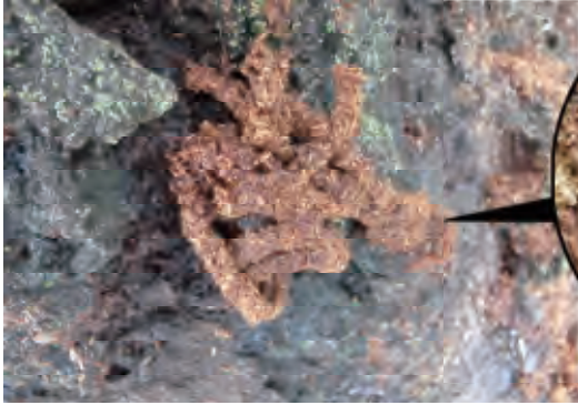
フラス 幼虫が樹木(写真はサクラ)の幹に開けた排出口から排出したフラスです。色は茶色又は黄褐色で、特徴的な「あらびきのひき肉」状をしています。4月頃から秋にかけて活発に排出されます。