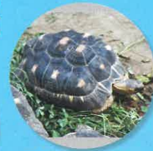
マダガスカルホシガメ