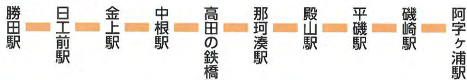
ひたちなか海浜鉄道湊線

ひたちなか市には、平成28年3月現在、66の指定文化財があります。(国指定2, 茨城県指定14, ひたちなか市指定50)